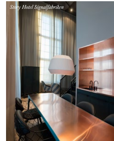
Story Hotel Signalfabriken