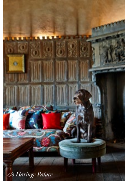
c/o Haringe Palace