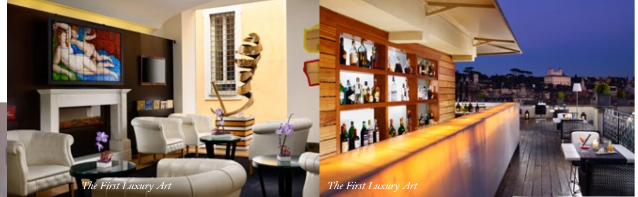
The First Luxury Art