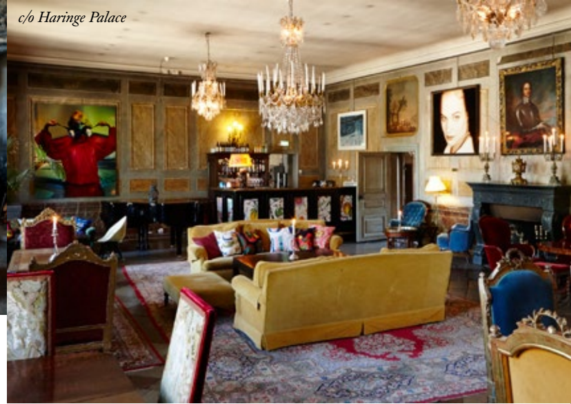
c/o Haringe Palace